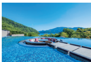
箱根・芦ノ湖 はなをり

「函館・湯の川温泉 ホテル万惣」「会津・東山温泉 御宿 東鳳」「箱根・芦ノ湖 はなをり」「箱根・強羅 佳ら久」「黒部・宇奈月温泉 やまのは」「熱海・大月ホテル 和風館」「ホテル ミクラス」「別府温泉 杉乃井ホテル」「クロスホテル 札幌」「クロスホテル 京都」「クロスホテル 大阪」「ホテル ユニバーサル ポート」「ホテル ユニバーサル ポート ヴィータ」